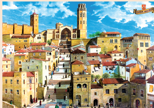
Enric Garsaball, Museu d'Art Jaume Moreira

6 Has arribat a la Porta dels Apòstols. Un joc de diferències: el dibuix de sota reproduïx com eren la porta i els voltants de la Seu Vella fa gairebé 500 anys. Encercla la porta al dibuix i digues quines diferències hi veus respecte a la porta i el turó actuals.