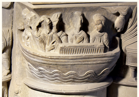
כותרת המוקדש לסנטיאגו

בתוך הקתדרלה יש קפלות שונות (המאה ה-13-14) הבנויות כמו מקומות קבורה פרטיים קדושים. אזכור מיוחד מגיע לקפלת של תומאס הקדוש (8) , שבה הייצוג המרכזי של הבתולה והילד בשילוב עיטור שזור שקיבל השפעה אסלאמית, עדים מהעבר אנדלוסי של לידה והקפלה רקסננס (9) , אשר שיקומה אפשרה להדגיש גימורים פיסוליים עדינים.