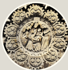
מפתח קמרון. כנסיית הקבר. המאה ה-14