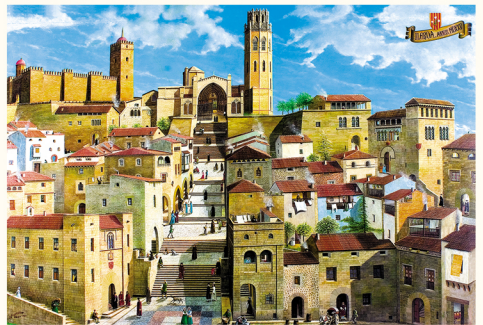
ליידיה, שנה 1525. מוזיאון לאומנות חאומה מרארה, ליידיה (אנריק גרסבל)

מבני ההגנה החדשים שנבנו על הגבעה החל מהמאה השבע עשרה הן בעלות קירות משופעים בעלי קצב שבור, עם כניסות ויציאות, שמטרתן ליצור מערכת של קצוות זוויות כדי להגן על כל המרחב הסובב.