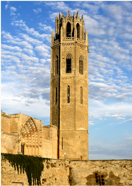
מגדל הפעמון ושער השליחים

זהו הסמל הבלתי מעורער של העיר והפניה חזותית מרחוק. בגובה 60.60 מ', אפשר לעלות לחלק העליון באמצעות 238 מדרגות ספירליות ולהתבונן בנוף הפנורמי. מומלץ לא להשאיר אותו לסיום הביקור, מכיון שהמגדל הפעמונים נסגר לציבור כחצי שעה לפני שאר האנדרטה.