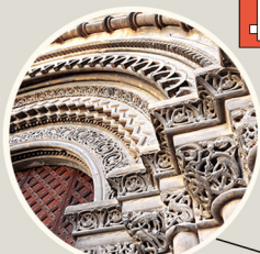
קשתות. שער מרכזי