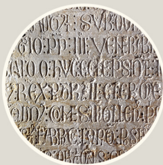
מצבה קבורה 1203

כי החור המרובע באמצע הצירים היה למעשה ארון? שם נשמר השריד המפורסם ביותר של הקתדרלה: החיתול הקדוש או החיתול הראשון של ישו.