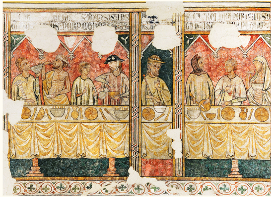
ציורים של פייה אלמוניה. מוזיאון ליידה (א. באנוטה)

ניתן לבקר בתחילת או בסוף הסיור. רצוי לעצור בפיא אלמוניה (1), מוסד צדקה שהאכיל את העניים ואת עולי הרגל שעצרו בקתדרלה, בדרך לסנטיאגו דה קומפוסטלה. שניהם נמצאים בציורי הקיר (מאה ה-14-16) אשר עיטרו מוסד זה. הציורים המקורים הם במוזיאון ליידה.