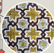
ציורים עם השפעה אסלאמית