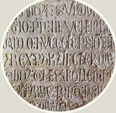
جزء تفصيلي شاهد القبر التذكاري 1203

التقب مربع الشكل المحدث في اللوحات كان في الواقع خزانة؟ فيها كان يتم الاحتفاظ بأثار الكاتدرائية الأكثر شهرة: الحفاظة المقدسة أو الحفاظة الأولى للطفل يسوع