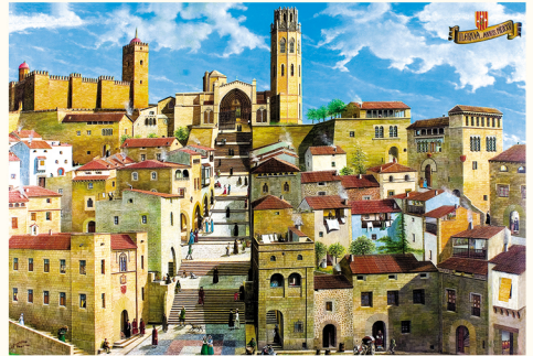
ليردة، سنة 1525. متحف الفنون خاومي موريرا، ليردة (البريك غراسبال)

المباني الدفاعية الجديدة التي تم بناؤها في التل انطلاقا من القرن السابع عشر تمثل حيطان منحدره والجدران لها وتيرة منكسرة مع مداخل وحواف هدفها هو توليد مجموعة من النقاط والزوايا المصممة لحماية كل المساحة المحيطة