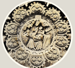
الحجر التبرجي للقبر. المصلى الكنسي ريكسينس. القرن الرابع عشر