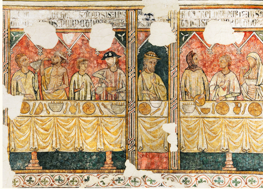
لوحات بيت الفقراء. متحف ليردة (إ. بيلغيتي)

يمكن زيارتها سواء في أول أو في آخر الجولة. من الأنسب التوقف عند بيت الفقراء (1)، مؤسسة خيرية كانت تعيل الفقراء والحجاج الذين كانوا مجبرين على الاستراحة في الكاتدرائية، طريق سان تياغو دي كومبوستيلا. بعض من هؤلاء حاضرون في اللوحات الجدارية (القرن الرابع عشر- القرن السادس عشر) التي كانت تزين هذه المؤسسة. النسخ الأصلية تتواجد بمتحف ليردة