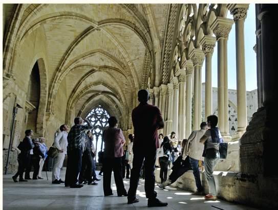
الصلاة الشمال شرقية للدير

هذه الأصالة ازدادت حضورا بفضل الصلاة الجنوب شرقية المطلة حصرا على المدينة على شكل مَطلٍ (2) مميز