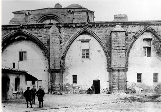
قناة الدير. أواسط القرن العشرين (ترشف فيرونت، كواله، ليردة)

يمكن زيارتها سواء في أول أو في آخر الجولة. من الأنسب التوقف عند بيت الفقراء (1)، مؤسسة خيرية كانت تعيل الفقراء والحجاج الذين كانوا مجبرين على الاستراحة في الكاتدرائية، طريق سان تياغو دي كومبوستيلا. بعض من هؤلاء حاضرون في اللوحات الجدارية (القرن الرابع عشر- القرن السادس عشر) التي كانت تزين هذه المؤسسة. النسخ الأصلية تتواجد بمتحف ليردة