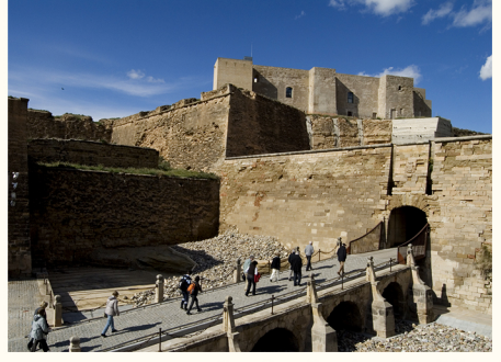
قصر الملك - لا سودا من الجسر المتحرك