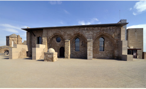
الواجهة الشمالية لقاعة المحكمة القديمة

قاعة المحكمة تتوفر على شرفة علوية يمكن للجميع أن يصلوا إليها وتعتبر المثل الأفضل للمدينة، منها يمكن مشاهدة المناظر الأكثر قربا والأكثر بعدا