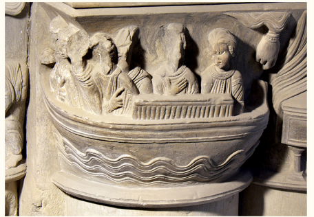
تاج عمود سان تياغو

زيارة الكاتدرائية تكتمل بجولة خارجية تبدأ من الباب القوطي للحواريين (12) ، الواجهة الرئيسية للكاتدرائية وتستمر الجولة بأبواب الكنيسة التي هي كلها رومانية. الأكثر بساطة هي باب سان برينغاريو (13) . باب البشارة (14) و باب إبلس فييولس (15) هما أكثر جمالا بفهما المعماري العظيم وزخرفة وفيرة في أقواس الأركيفولنت، الأفاريز وطفن التاج