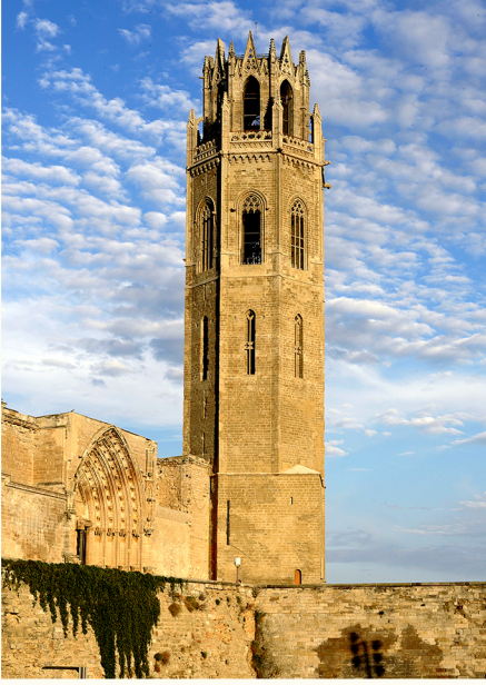
برج الأجراس وباب الجواريين

في صدر الكنيسة الرئيسي (5) يوجد شاهد قبر تذكاري لوضع الحجرة الأصلية (22 يوليو 1203) ومجموعة من اللوحات الجدارية (الثلث الأول من القرن الرابع عشر) مع مشاهد من حياة يسوع ومريم