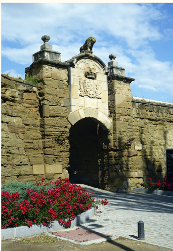
باب الأسد. القرن التاسع عشر

تشيد هذه المدينة الصغيرة كان يقتضي اختفاء الحي القوطي القديم المعروف باسم حي لا سودا. الحي الذي كان في الأساس كنانسيا، شريفا