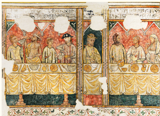
ציורים של פייה אלמוניה. מוזיאון ליידה (א. במאונטה)

ניתן לבקר בתחילת או בסוף הסיור. רצוי לעצור בפיא אלמוניה (1), מוסד צדקה שהאכיל את העניים ואת עולי הרגל שעצרו בקתדרלה, בדרך לסנטיאגו דה קומפוסטלה. שניהם נמצאים בציורי הקיר (מאה ה-14-16) אשר עיטרו מוסד זה. הציורים המקורים הם במוזיאון ליידה.