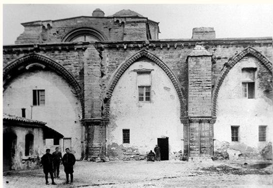
חצר המנזר. אמצע המאה העשרים

ניתן לבקר בתחילת או בסוף הסיור. רצוי לעצור בפיא אלמוניה (1), מוסד צדקה שהאכיל את העניים ואת עולי הרגל שעצרו בקתדרלה, בדרך לסנטיאגו דה קומפוסטלה. שניהם נמצאים בציורי הקיר (מאה ה-14-16) אשר עיטרו מוסד זה. הציורים המקורים הם במוזיאון ליידה.